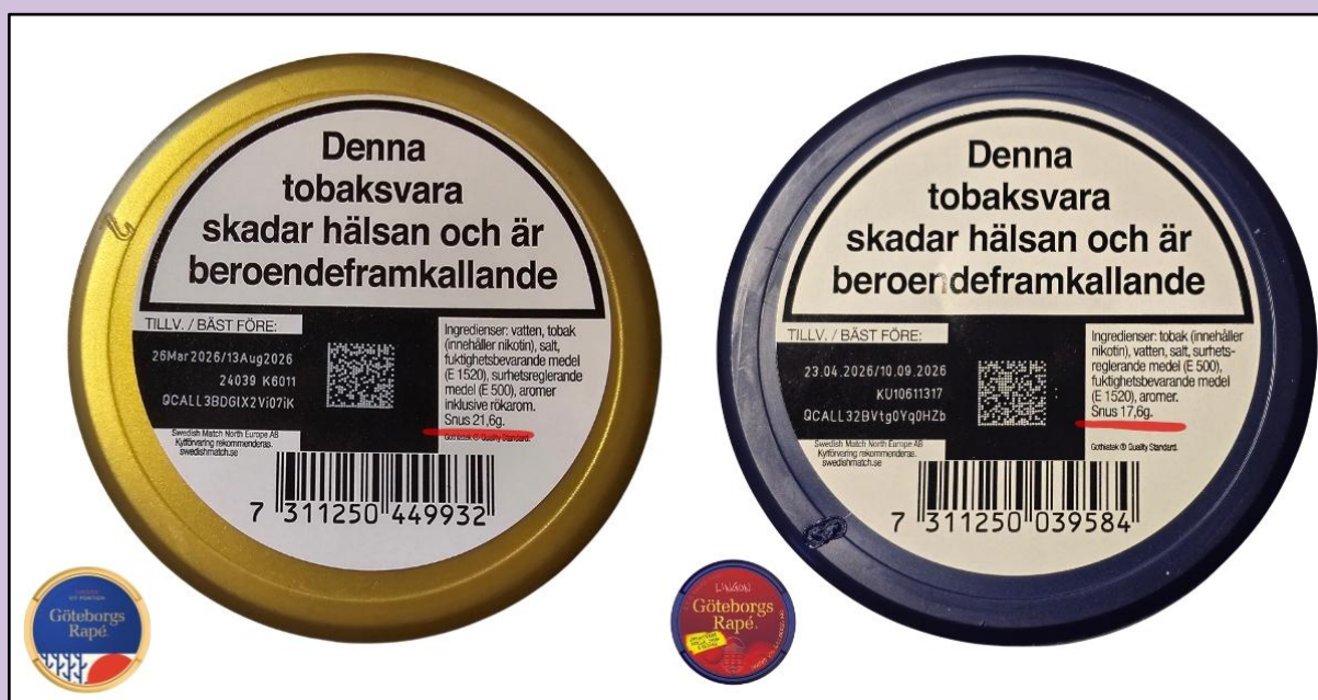
Göteborgs Rapé Lingon Vit Portion, före (vänster) och efter (höger)

Vid köp av dosan i fysisk butik framgår dock vikten genom att kolla på baksidan. Vikten har mycket riktigt minskat ner till 17,6 gram. Antalet är dock 22, vilket innebär att Swedish Match har minskat vikten per prilla utöver att ha minskat antalet prillor.